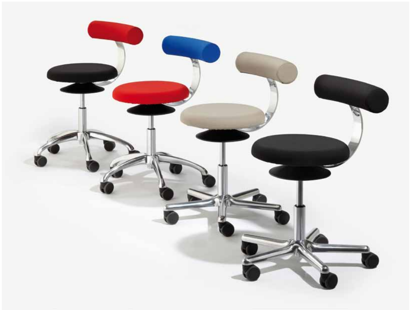
AOGO A und AOGO E