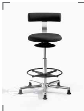
AOGO XL E