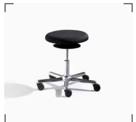
ERGO 3 E