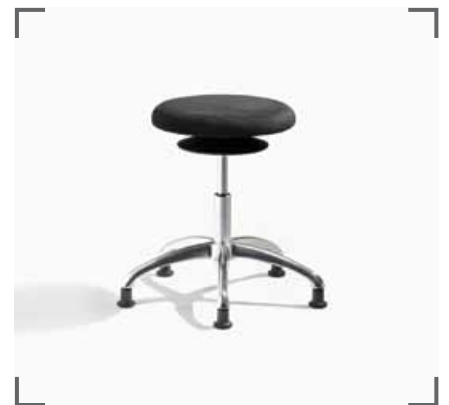
ERGO 3 A