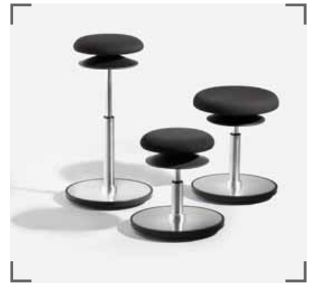
ERGO 1 und ERGO 2