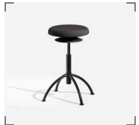
ERGO 3 V