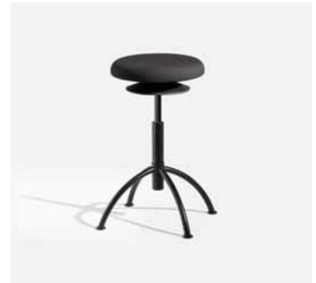
ERGO 3 V