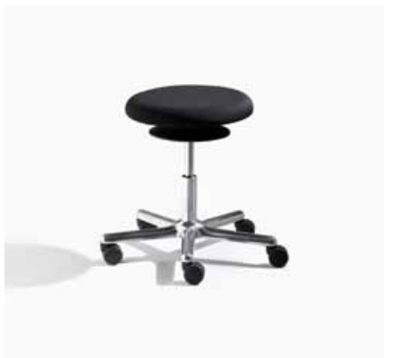
ERGO 3 E