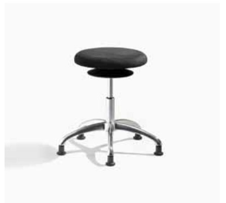
ERGO 3 A