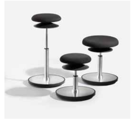
ERGO 1 und ERGO 2